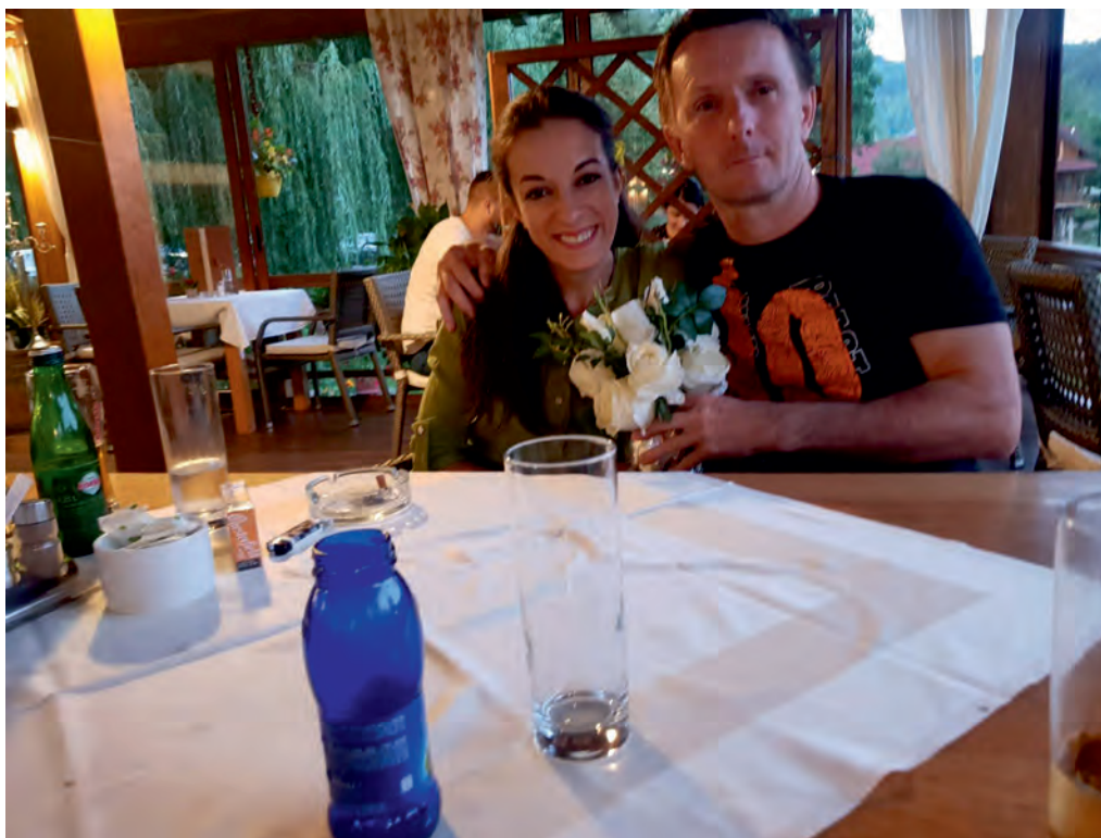
sa životnom saputnicom