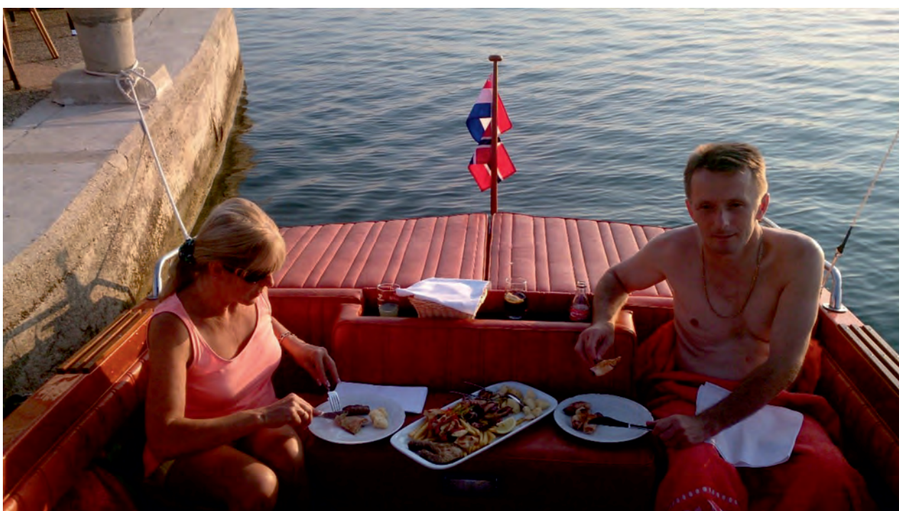
sa sestrom u Crikvenici

Ma, bez podrške porodice život je težak i pun pogrešnih odluka, pravaca i kolosijeka, jer je porodica osnova za sve. Iz porodice počinje sve, još od rođenja, od malih nogu. Odgoj djeteta i njegov odnos prema drugim osobama, a pogotovo prema osobama s invaliditetom. Djeci treba objasniti da su osobe u kolicima ili drugim oblikom invaliditeta kao i svi drugi ljudi, ali da imaju svoj tjelesni problem i da tako moraju živjeti, te da stanje invalidnosti nije nikakva sramota, a pogotovo ne predmet za izrugivanje ili strašenje. Mi, osobe s težim oblikom invaliditeta, prilično smo emotivni, ponekad i previše, što nije dobro u životu, ali život je takav i mi treba da naučimo da uživamo u njemu i malim životnim sitnicama koje su veliko bogatstvo.