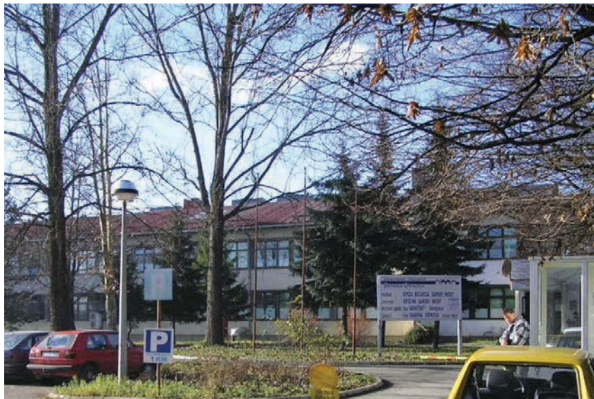
JU Dom zdravlja Sanski Most

drugi po veličini i broju stanovnika u Unsko-sanskom kantonu i u kojem je smješteno više političkih institucija USK, ali zato nema potrebnih ljekara. Istina, svi osiguranci koji moraju putovati zbog ljekarskih specijalističkih usluga u Bihać ili Ključ imaju zakonsko