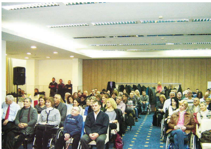
Osobe s invaliditetom na jednom od skupova koji se bave problemima ove populacije

Organizacije osoba s invaliditetom radno angažiraju osobe s invaliditetom čija je radna sposobnost smanjena, a veliki broj njihovih saradnika i volontera također su osobe s invaliditetom, zbog čega ove organizacije ne mogu biti konkurentne drugim nevladinim organizacijama koje su najčešće nečlanske (nemaju članova) i koje, u