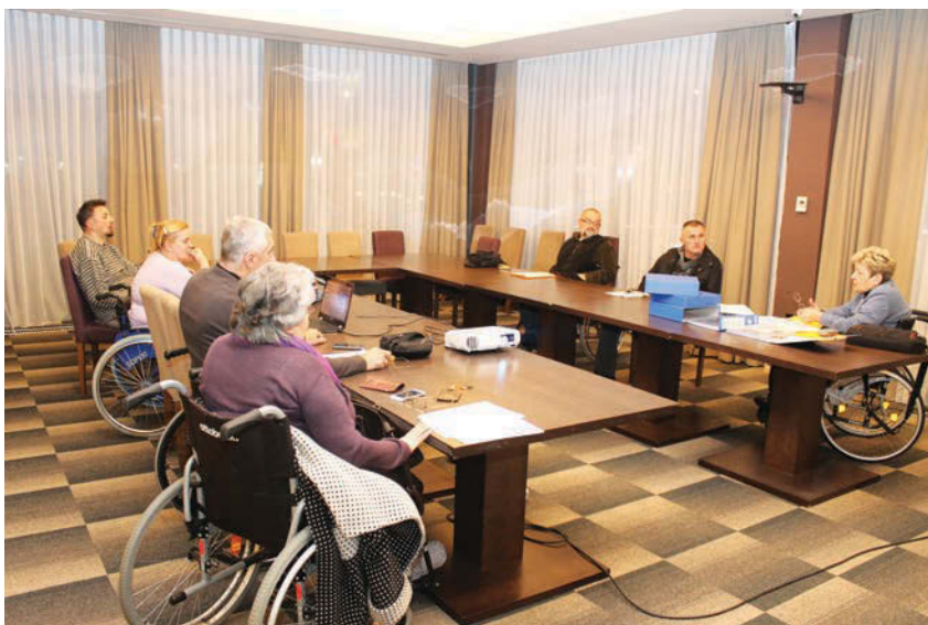
Pripremni sastanak za konferenciju u Doboju