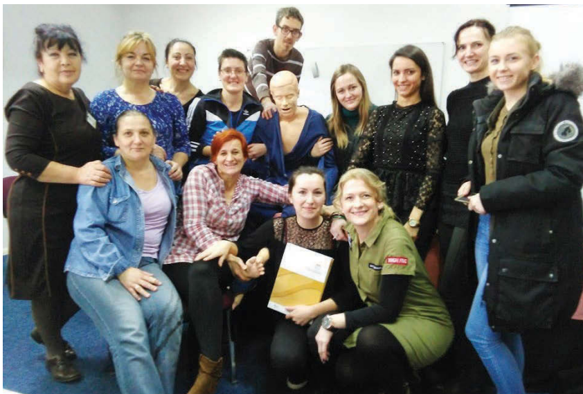
Osobni asistenti za osobe s invaliditetom

Udruga paraplegičara i oboljelih od dječje paralize Livanjskog kantona, uz podršku Ministarstva rada, zdravstva, socijalne skrbi i prognanih Kantona 10, realizira projekt pod nazivom “Ti zaslužuješ zdraviji život!” Projektom je obuhvaćeno šestero djece s invaliditetom teže kategorije i njih fizioterapeut obilazi u njihovim domovima, gdje im se pruža potrebna terapija, uz obilazak i nadzor stručnog kadra – fizijatra.