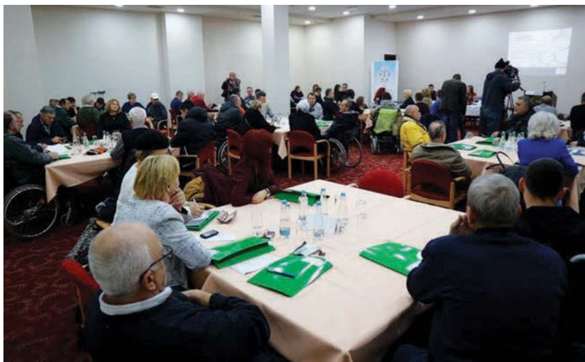
Učesnici svečane akademije održane povodom 3. decembra