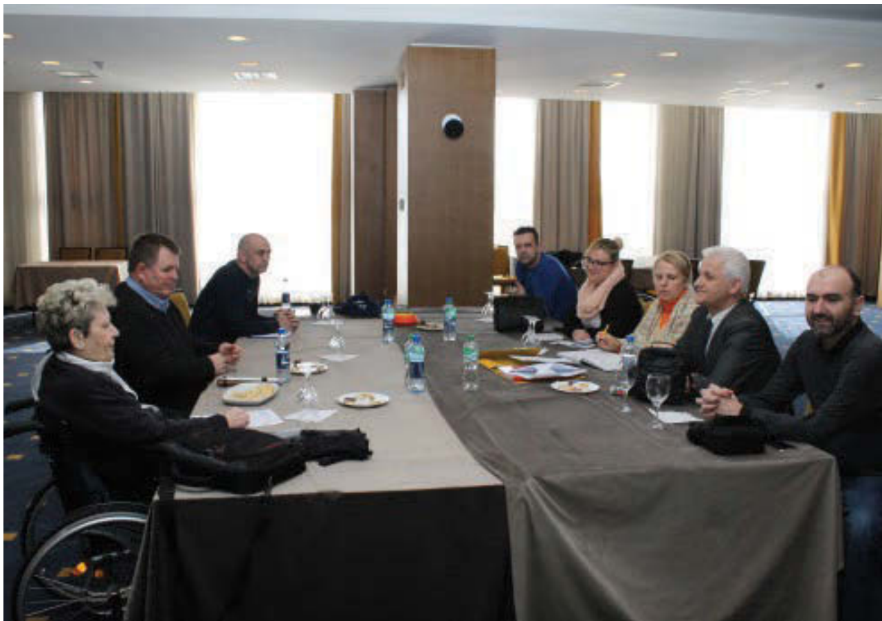
Prvi sastanak UOLSIuBiH