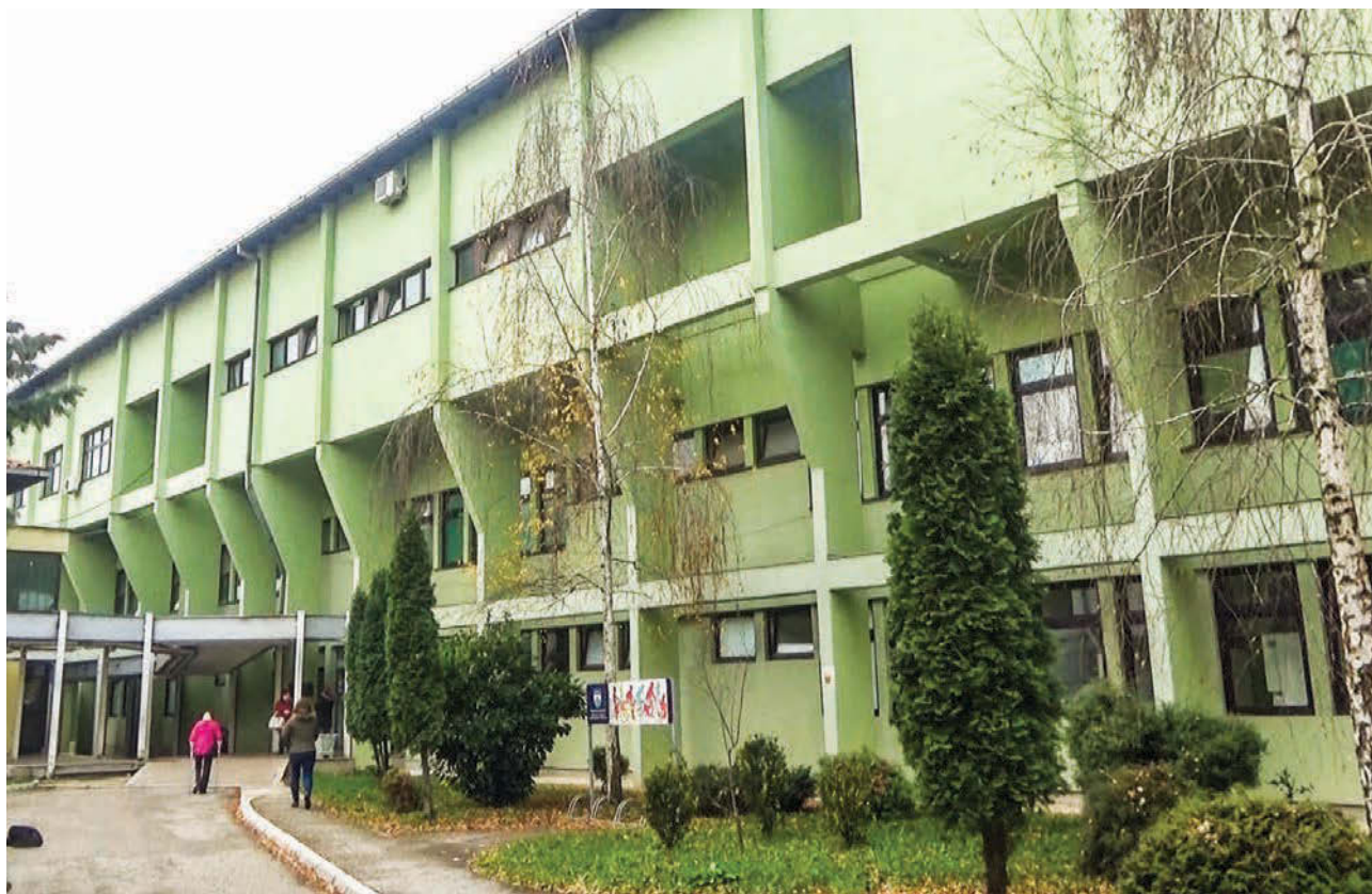
Opća bolnica Sanski Most

pravo na refundaciju putnih troškova, ali do sada niko nikada nije uspio ostvariti to pravo na refundaciju!? Jednostavno, u Sanskom Mostu zdravstvo ne funkcionira niti po zdravstvenoj “liniji” niti po zakonu.