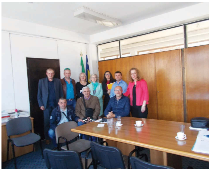
S predstavnicima ZZO ZE-DO kantona

Zapošljavanje osoba s invaliditetom stalni je prioritet u programu rada Udruženja te aktivnostima u vezi s time posvećujemo veliku pažnju. U