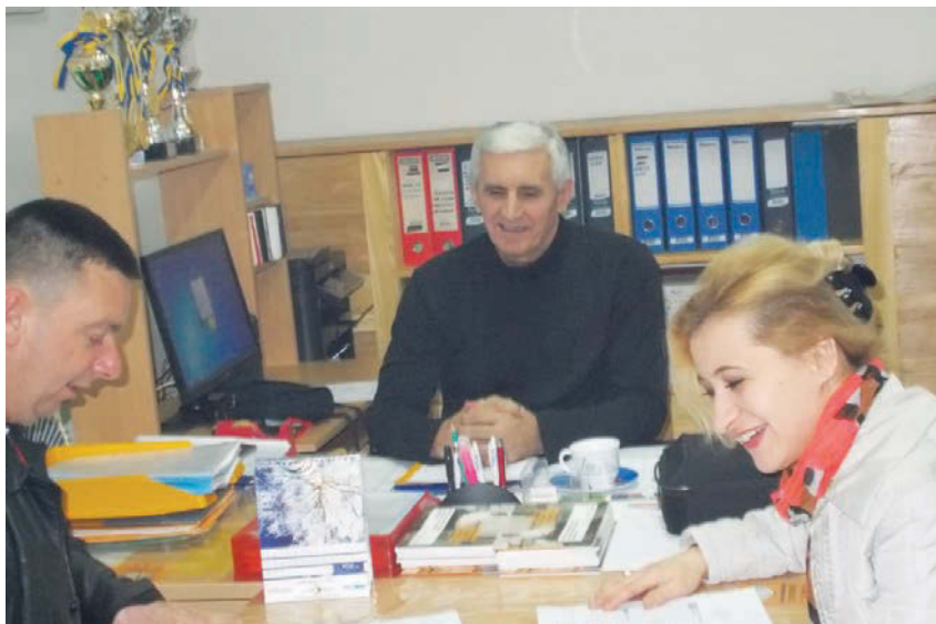
Sjednica Nadzornog odbora udruženja