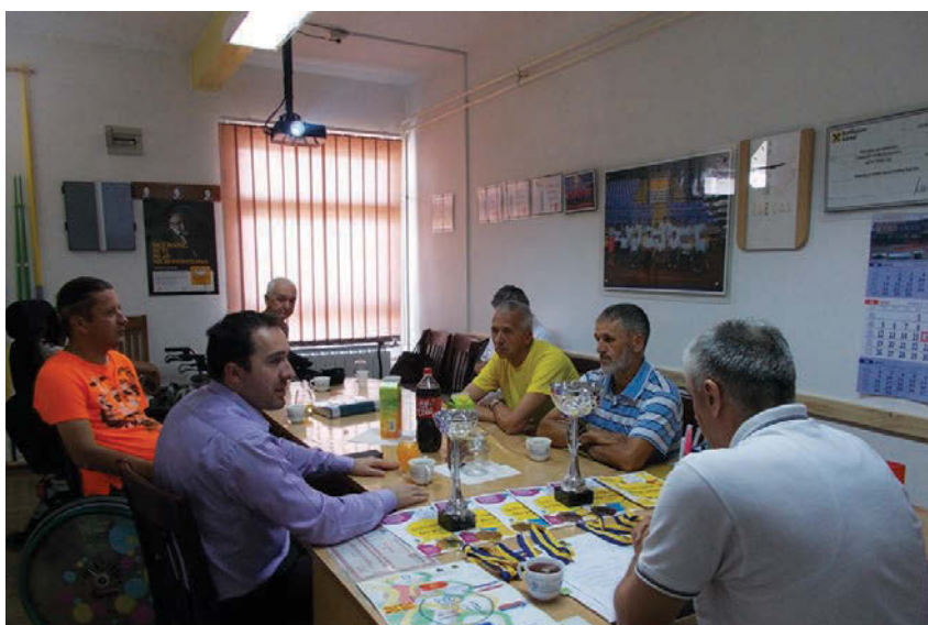
Sastanak s načelnikom općine Doboj Jug

saveza / udruženja članica, što je u najkraćem roku i učinjeno.