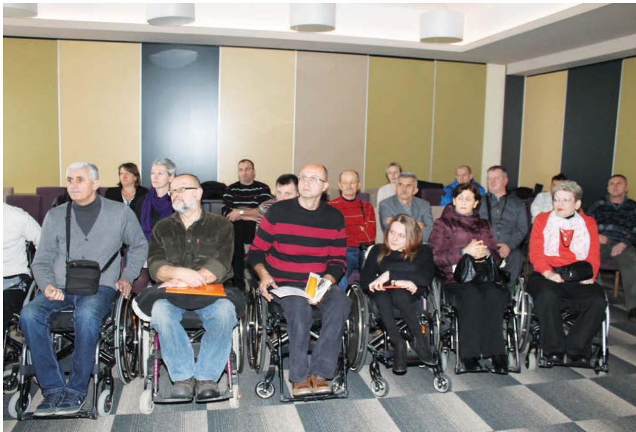
Učesnici konferencije u Doboju