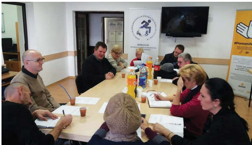
Sastanak Koalicije organizacija osoba sa invaliditetom Tuzlanskog kantona